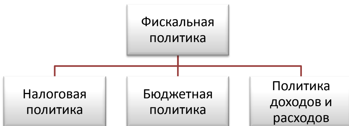
Рис. 2. Формы фискальной политики в Российской Федерации [3]

Фискальная политика (по К. Р. Макконнеллу и С. Л. Брю) – это сознательное манипулирование налогами и государственными расходами, осуществляемое органами власти для стимулирования экономического роста, контроля над инфляцией и изменения реального ВВП и уровня занятости населения страны. В Российской Федерации фискальная политика является одним из главных аспектов экономической политики государства и включает в себя несколько форм (рис. 2). Безусловно, вопрос об увеличении стабильного прироста государственного бюджета и повышении эффективности государственных расходов остаётся и, на наш взгляд, будет всегда оставаться одним из главных для экономики любой страны.