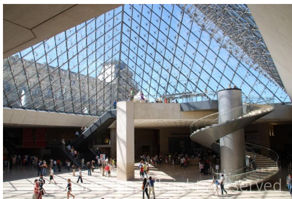
Рисунок 3 – Музей Лувр, центральный холл

Современное вмешательство в исторические ансамбли, кардинально меняет восприятие фасадов дворца. Исторические фасады смотрятся как ровная статическая декорация со спокойной ритмичностью, создавая фон для динамического движения от маленькой пирамиды к большой и обратно на стремительный скат к противоположной небольшой. Если рассматривать центральную фигуру, то она определенно добавляет фасаду движения вверх, стремления, и, можно сказать, что без маленьких пирамид, одна большая смотрелась бы очень статично и не создавалось бы горизонтального движения.