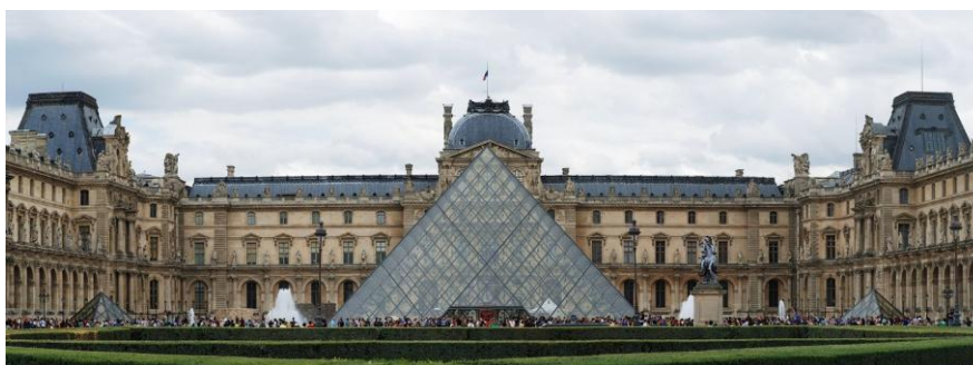
Рисунок 4 – Музей Лувр современный вид

Исторически сложившееся и новое в облике музея, рассмотренное по отдельности очень противоречивы, но в сочетании они дополняют друг друга, создавая абсолютно новый облик дворца.