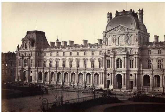
Рисунок 1 – Музей Лувр конца 19 века

В самом центре исторического Парижа располагается, жемчужина музеев мира, одно из самых посещаемых мест Франции – это Лувр. Архитектурная история комплекса не менее увлекательная, чем он сам. Почти тысячу лет назад, в 1190 году, была возведена крепость-замок – Большая башня Лувра, на протяжении столетии замок перестраивали и перестраивали постепенно превращаясь в прекрасный дворец.