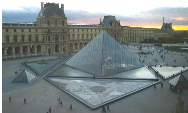
Рисунок 2 – Музей Лувр современный вид

Современное вмешательство в исторические ансамбли, кардинально меняет восприятие фасадов дворца. Исторические фасады смотрятся как ровная статическая декорация со спокойной ритмичностью, создавая фон для динамического движения от маленькой пирамиды к большой и обратно на стремительный скат к противоположной небольшой. Если рассматривать центральную фигуру, то она определенно добавляет фасаду движения вверх, стремления, и, можно сказать, что без маленьких пирамид, одна большая смотрелась бы очень статично и не создавалось бы горизонтального движения.