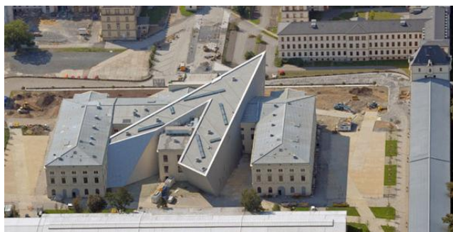
Рисунок 6 – Вид на военно-исторический музей

Современный музей состоит из двух элементов: здания, построенного в 1877 году и сооруженной в 2011 году пристройки, архитектором которой стал ярчайший представитель деконструктивизма – Даниель Либескинд. Пристройка представляет собой клинок, врезающийся в фасад исторического здания. Структурой клинка архитектор хотел показать игру света и тени, которая напоминает военную историю самой Германии, такую же контрастную, такую же противоречивую, что поддерживается экспозицией музея, которая направлена на разностороннюю интерпретацию и переосмысление привычного зрительного восприятия.