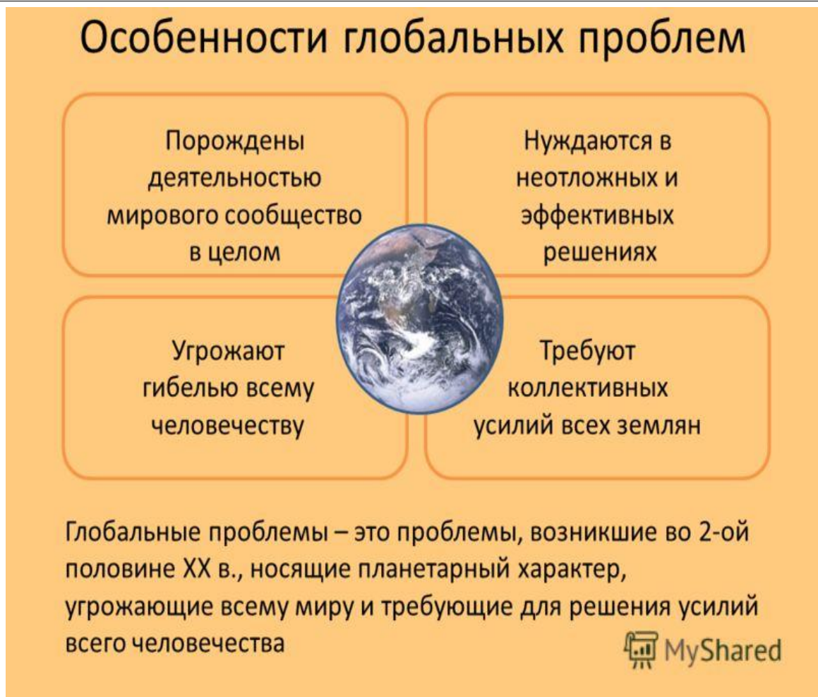
Рисунок 1 – Особенности глобальных проблем

Рисунок 1 наглядно подтверждает наши высказывания ранее. Однако, по-нашему мнению, в настоящее время существуют такие проблемы, которые практически нигде не отражаются, но в будущем каждый из нас может понести колоссальный вред. Как мы считаем, проблема целеполагания и, как следствие, внутренней мотивации - являются одними из главных в текущем периоде. Так или иначе каждый из нас сталкивался с ситуацией, когда хотелось добиться высоких результатов будь то в спортивной, учебной, научно- исследовательской деятельности в школе, институте или же на работе, но из-за собственной прокрастинации люди отказываются от своей мечты. Задается вопрос: почему же люди так легко сдаются? Именно на этот вопрос будут представлены ответы в текущей статье.