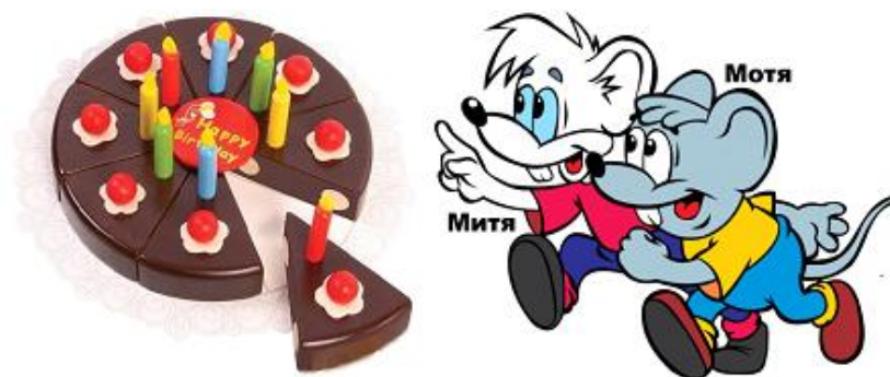
Рисунок 2 – Торт кота Леопольда

– Посмотри, Мотя, какой торт испек Леопольд (рис. 2).