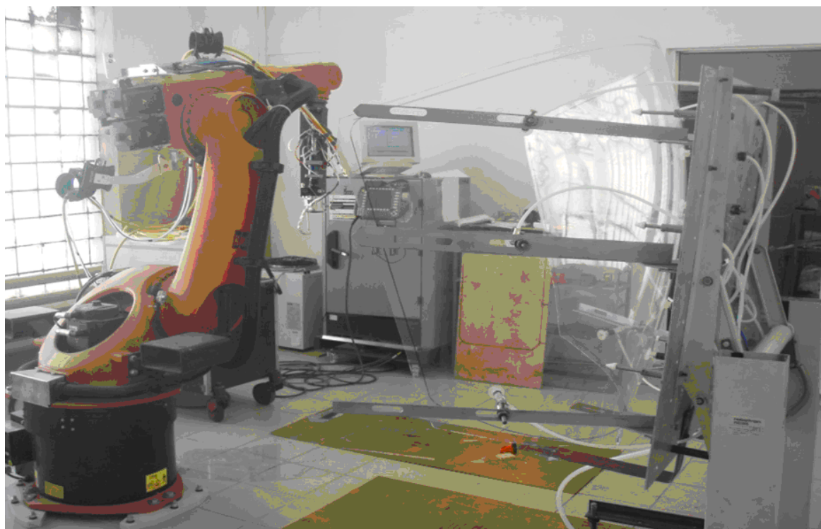
Рис 2. Роботизированный комплекс лазерной резки стекла

Эксперимент проводился следующим образом. При заданной средней мощности (500 Вт) лазерного излучения непрерывного волоконного иттербиевого лазера с длиной волны 1,065 мкм проводилась резка силикатных стёкол марки optic white различной толщины методом сквозного управляемого термораскалывания. При выбранной толщине стекла