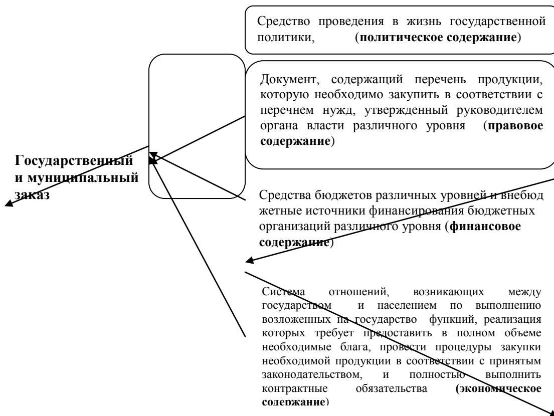
Рис.3 Понятие ГМЗ

На основании изложенного, автор считает, что понятие ГМЗ представляет собой категорию, сочетающую в себе экономическое, правовое, финансовое и политическое содержание, каждое из которых заслуживает внимания и не может быть проигнорировано (рис.3).