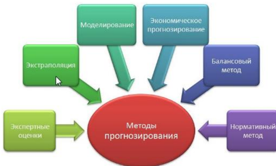
Рис.1.Методы прогнозирования изменения экономических показателей

На сегодняшний день, для прогнозирования изменения динамических показателей, в том числе и в экономической сфере студенты знакомятся со следующими методами прогнозирования (см.рис.1).