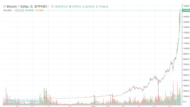
Рисунок 2 – Динамика курса доллара за 1 биткойн, 2016-2017 гг.

прокладывает путь остальным системам на рынке. Влияние факторов наглядно показано на динамике роста биткойна на рисунке 2.[9]