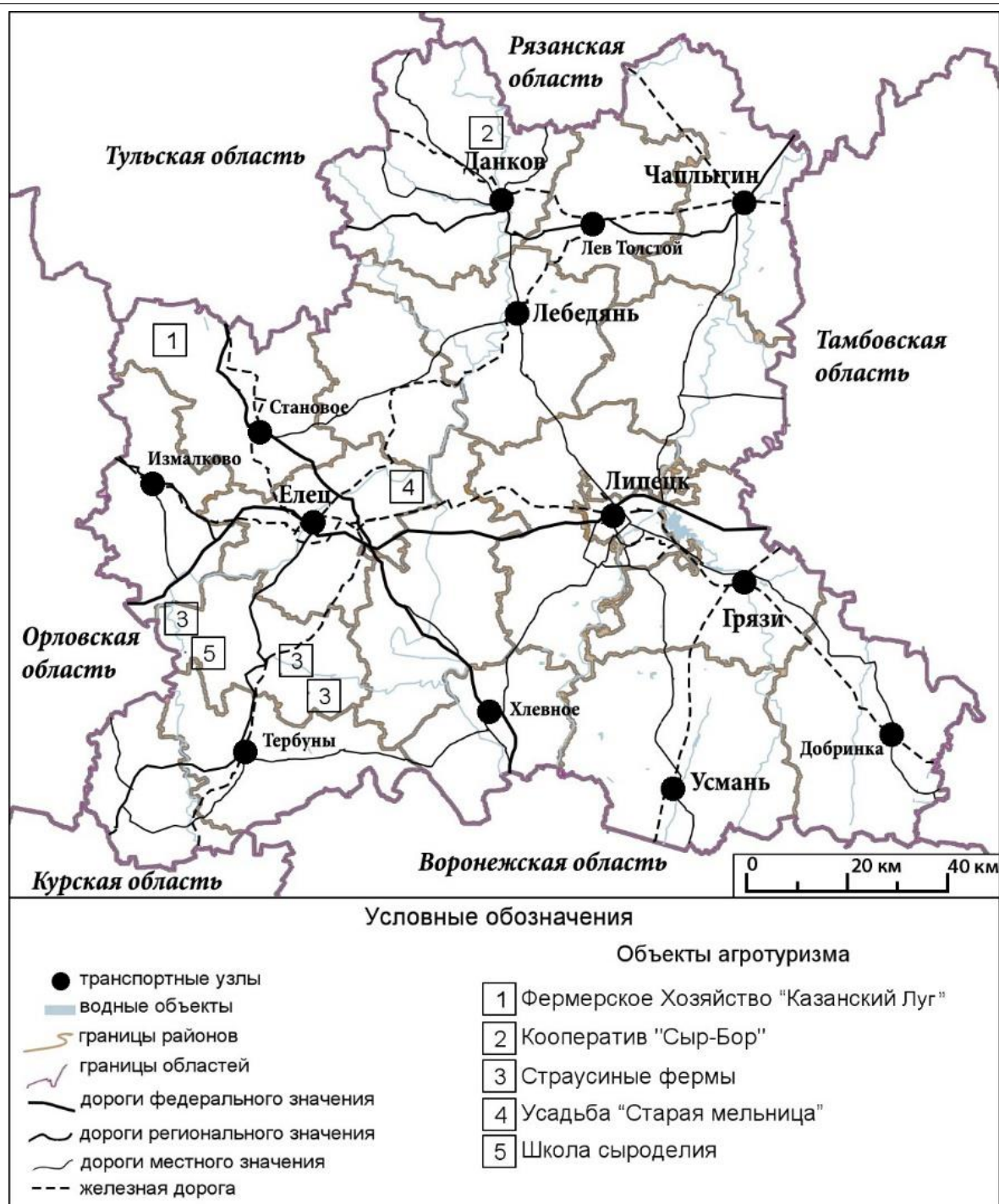
Рис. 2. Каркас агротуризма Липецкой области

По сравнению с соседними Воронежской и Курской областями, где предприятия агротуризма располагаются вблизи административного центра, перечисленные выше объекты находятся в отдалении от областного центра г. Липецк, на севере, западе и юго-западе области.