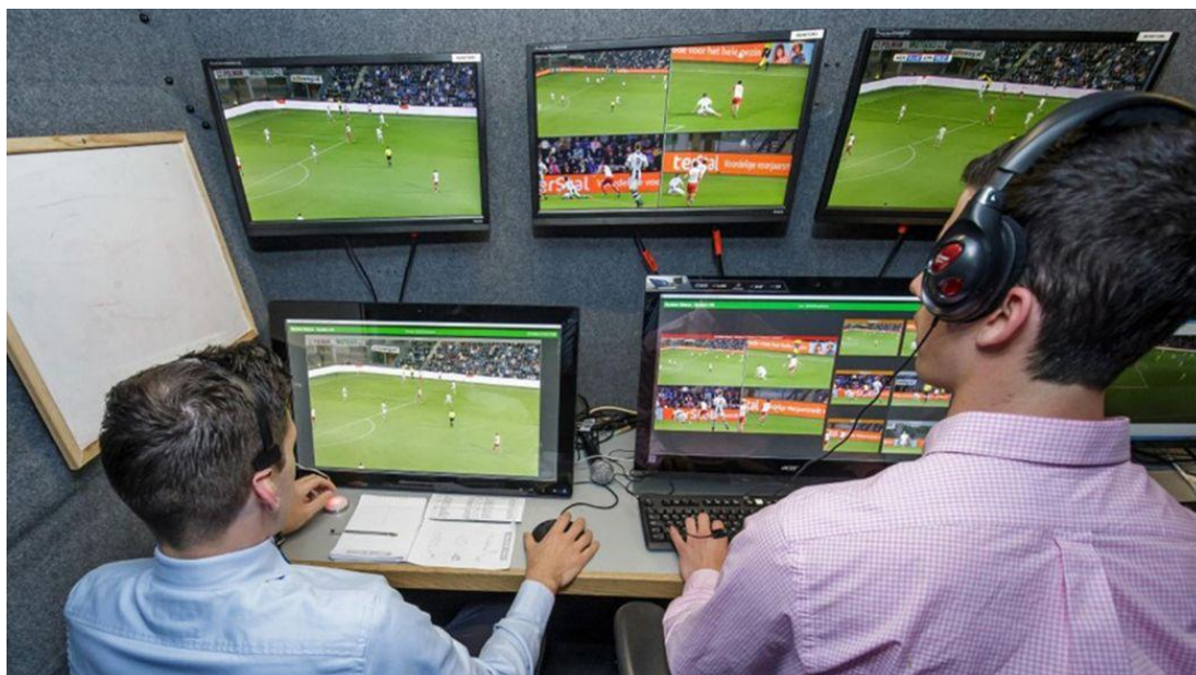
Рис 1. Система видеопомощи арбитра (VAR)

трансляцию видят и болельщики по телевидению), а второй монитор, поделенный на 4 части, используется для того, чтобы рассмотреть отдельный игровой эпизод с различных телекамер (рис. 1).