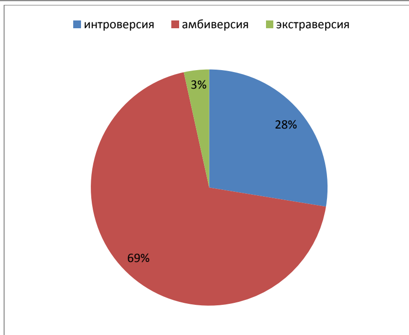
Рис.3. Процентные доли психологической типологии личности

Проанализировав данные опросов, были показаны результаты в процентных долях.