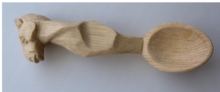
Рис. 10. Готовое изделие

Далее обрабатывалась тыльная сторона углубления «богородским» ножом. Этим же ножом выполнялось скульптурное изображение коня и изгибы ручки ложки. Поверхность была зачищена наждачной бумагой №10, №4.