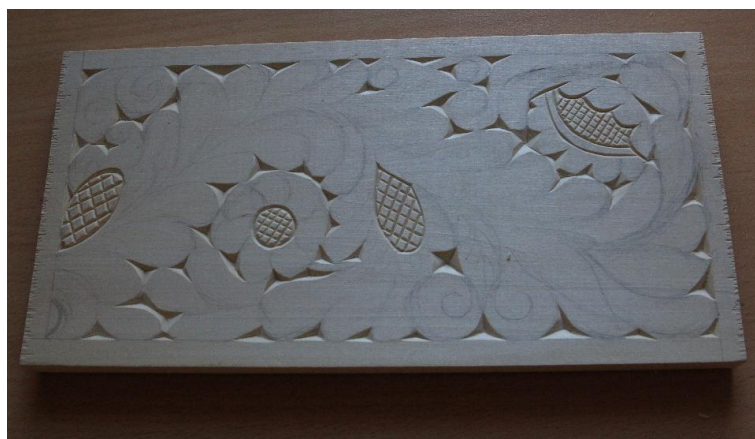
Рис. 13. Выполнение композиции, кудринская резьба

По площади вырезаем места соединения веток также по принципу геометрической резьбы.