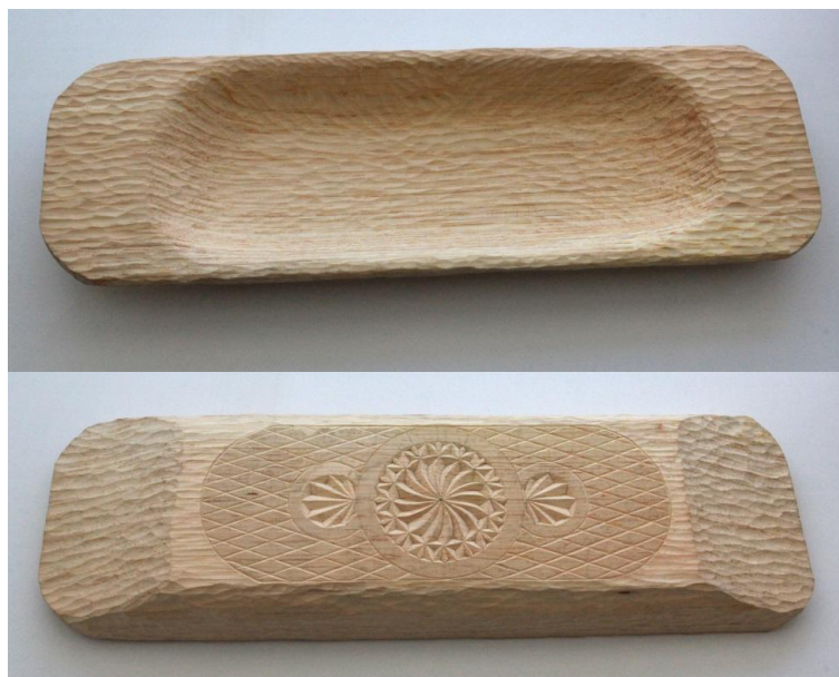
Рис. 8. Готовое изделие

Русская ложка. Первоначально на заготовке прорезается углубление под пищу полукруглой стамеской.