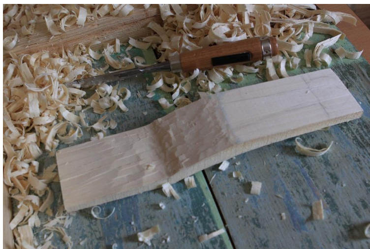
Рис. 3. Начальный этап – придание формы изделию

С помощью ножа прорезывалась более детальная форма.