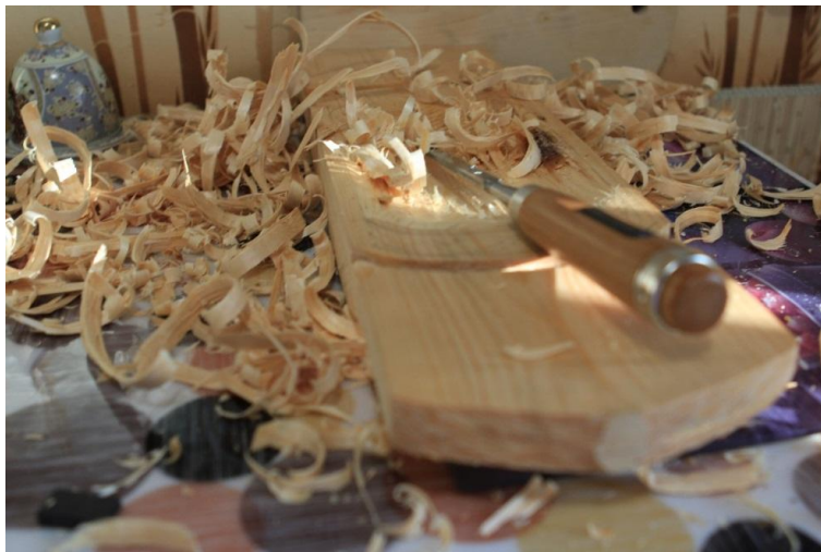
Рис. 6. Выполнение нанайской чаши

Нанайская чаша для рыбы. Первоначально была проведена выемка-углубление с помощью прямой стамески и загнутой стамески с прямым жалом.