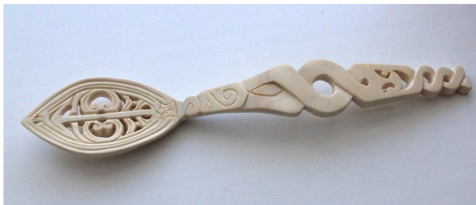
Рис. 5. Готовое изделие

Мелкие детали наносятся с помощью «богородского» ножа. Поверхность была зачищена наждачной бумагой №10, №4. Орнамент наносился с применением ножа-косяка после ошкуривания поверхности изделия.