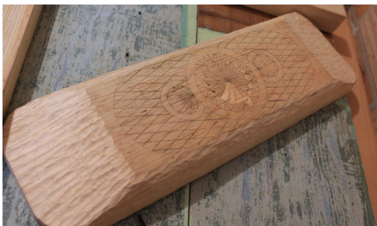
Рис. 7. Выполнение композиции в стиле русской традиционной резьбы

Работа производилась с применением полукруглой стамески, которая позволила обыграть эффект струящейся поверхности, сформированной множеством мелких полуовальных резцов-выемок. Также были обработаны края чаши и тыльная сторона. Низ чаши оставлен ровным для нанесения орнамента.