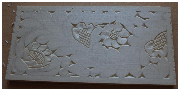
Рис. 14. Выполнение композиции, кудринская резьба

Подрезаем ножом-косяком листочки и выбираем стамеской-топориком.