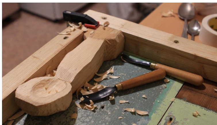
Рис. 9. Выполнение резьбы русской традиционной ложки

Русская ложка. Первоначально на заготовке прорезается углубление под пищу полукруглой стамеской.