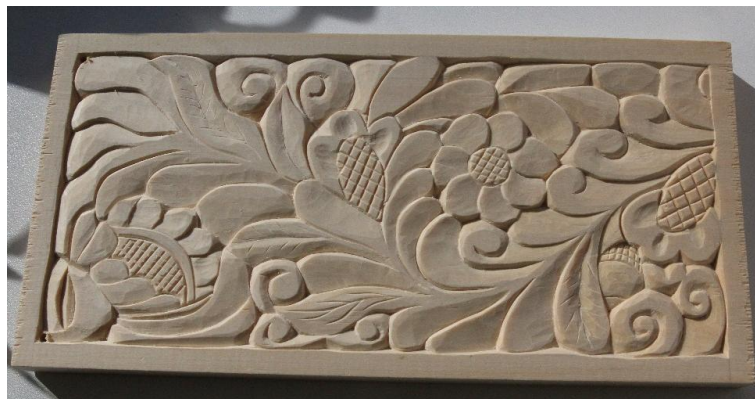
Рис. 15. Композиция, кудринская резьба

Обобщая вышесказанное можно сделать вывод: освоение искусства резьбы по дереву требует систематического, грамотного, поэтапного изучения всех составляющих резьбу моментов выполнения работы, начиная со знакомства с породами деревьев и инструментарием, до последней завершающей стадии работы.