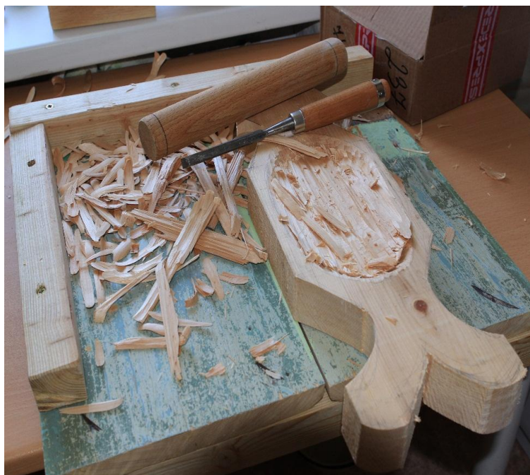
Рис. 1. Выполнение композиции в стиле нанайского народного творчества

Следующий этап работы – создание лицевой композиции чаши (образы рыбы, дракона). Завершающий этап композиционного построения – работа над стилизованным антропоморфным сэвэном, который расположен с тыльной стороны чаши и идея создания которого родилась в процессе работы над изделием, минуя этап эскизирования. Эти работы проведены «богородским» ножом и ножом-косяком. Углубление под пищу обрабатывалось полукруглой стамеской. Поверхность была зачищена наждачной бумагой №10, №4.