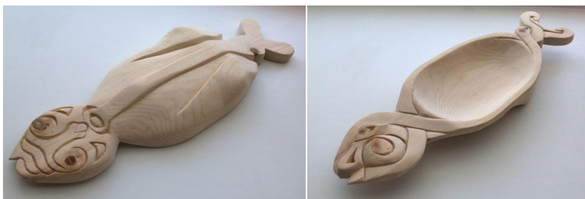
Рис. 2. Готовое изделие

Следующий этап работы – создание лицевой композиции чаши (образы рыбы, дракона). Завершающий этап композиционного построения – работа над стилизованным антропоморфным сэвэном, который расположен с тыльной стороны чаши и идея создания которого родилась в процессе работы над изделием, минуя этап эскизирования. Эти работы проведены «богородским» ножом и ножом-косяком. Углубление под пищу обрабатывалось полукруглой стамеской. Поверхность была зачищена наждачной бумагой №10, №4.