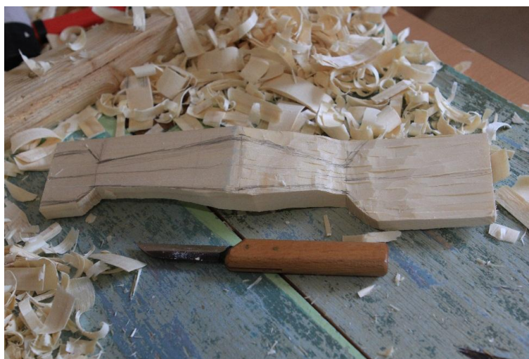
Рис. 4. Придание формы изделию

С помощью ножа прорезывалась более детальная форма.