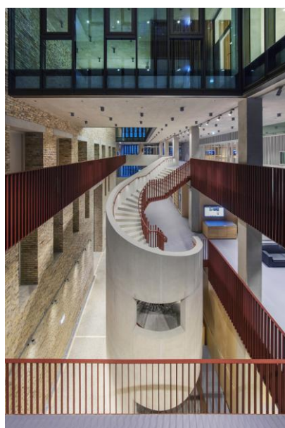
Рисунок 3 – Фрагмент внутренней части кампуса ЦЕУ

Новый кампус стал Меккой для студентов. Внутреннее пространство трудно назвать просторным, однако сочетание светлых оттенков, а также правильно расставленные акценты, делают свое дело. На первый взгляд трудно сказать, что все нагромождено, мы этого не замечаем, нам кажется, что все в гармонии, и только если присмотреться и провести анализ, то становится понятно, что на маленьком клочке исторического центра архитекторам удалось совместить старину, новизну и целый огромный кампус университета (рис. 3). Фасады, выполненные из известняка, хоть и современные, но отлично сочетаются с соседними памятниками архитектуры (рис. 4).