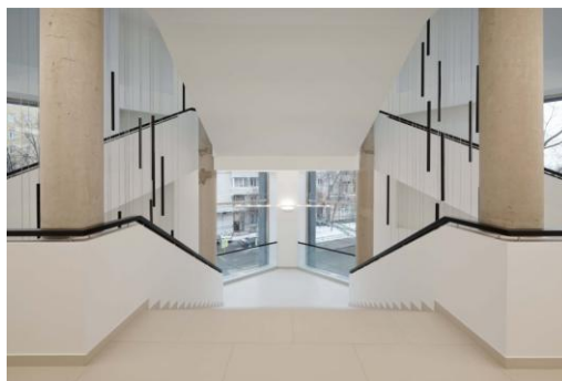
Рисунок 1 – Центральный холл бывшей фабрики-кухни после ревитализации

Применение белого оттенка мы можем наблюдать как во внутренней части здания, так на внешних фасадах. На самом деле здание блещет белизной. Вся внутренняя отделка объекта — это преимущественно белый цвет или светлые оттенки бежевого, а также был добавлен, в незначительном количестве, темный, почти черный цвет для обозначения акцентов на перилах лестниц, декоративных элементах и оконных обрамлений (рис. 1). Светлые оттенки зрительно расширяют помещение, делают его более воздушным, уютным и более приятным для офисных работников, которые будут проводить в нем все рабочее время, поэтому очень важно, чтобы им было комфортно и приятно находиться в нем. Внешняя отделка, также на девяносто процентов белый цвет и темные акценты на оконных и дверных обрамлениях (рис. 2). Здание хоть и небольшое, но все же памятник конструктивизму, и следуя его устоям, оно массивное. Место расположение – плотная историческая застройка центра Москвы. В следствие данных факторов, архитекторы хотели придать объекту внешнюю и внутреннюю легкость и белый цвет прекрасно с этим справился.