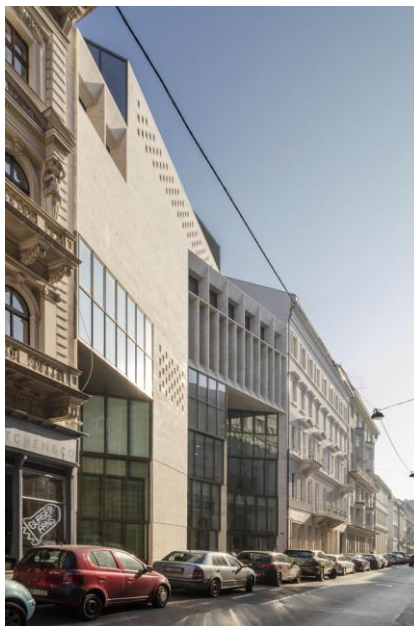
Рисунок 4 – Фасад Центрально-Европейского университета

В ходе рассмотрения двух объектов, которые являются яркими представителями данного способа, были выявленные положительные стороны его использования. Что касается отрицательных, то в первую очередь это сложность в поддержании внешней отделки в подобающем состоянии. Второе, мы можем наблюдать на сравнении внешней отделки двух объектов, в первом объекта из разнообразия цветом мы видим только черный, во втором объекте присутствует бордовый, а также светлый кирпич и известняк. На уровне наших ощущений, мы можем отметить, что находиться во втором интерьере нам гораздо приятнее и комфортнее. Следовательно, можно сделать вывод, то не смотря на всю светлость и просторность, но однотонность может нести за собой скуку и расстраивать рабочий лад сотрудников.