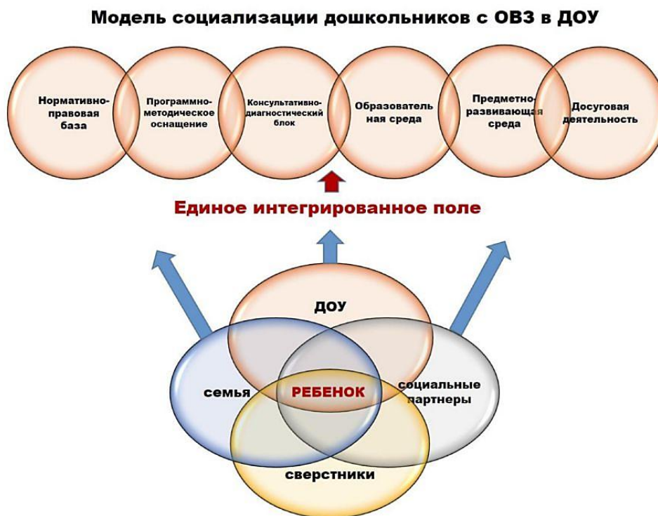
Рисунок 1 – Модель социализации дошкольников с ОВЗ в ДОУ

В центре нашей модели стоит ребенок (дошкольник с ОВЗ), вокруг него задействованы и находятся в тесном партнерстве, взаимосвязи все субъекты социального окружения: сообщество сверстников, семья, сотрудники, социальные партнеры ДОУ.