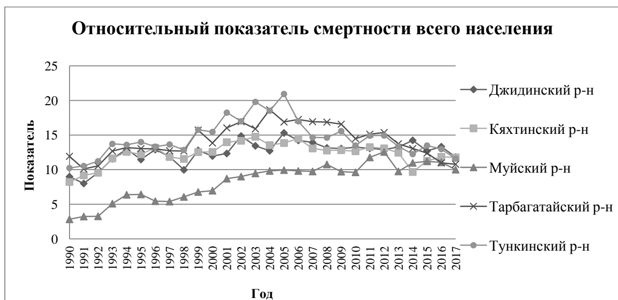
Рисунок 1 – Относительный показатель смертности всего населения

В данной работе рассмотрены показатели смертности 5 из 21 района Республики Бурятия: Джидинский, Кяхтинский, Муйский, Тарбагатайский, Тункинский. Выбор районов обусловлен их различным географическим положением и пограничными значениями показателя смертности относительно остальных. За период с 1999 по 2005 резко возросла смертность населения в Республике Бурятия, о чем свидетельствуют значения относительного показателя смертности 12,9 в 1999 году и 15,6 в 2005 году.