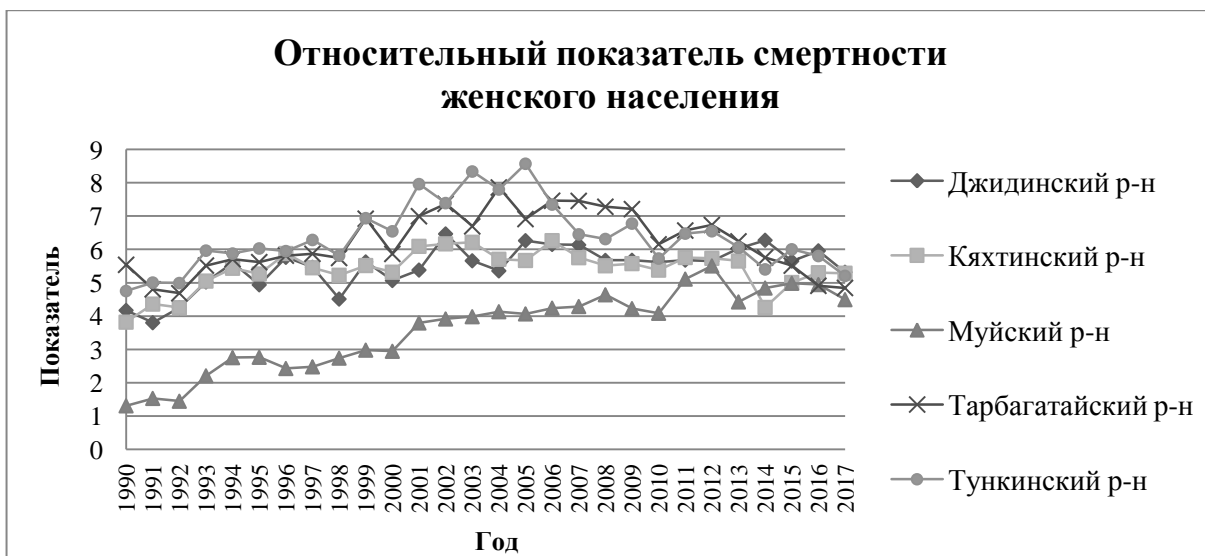
Рисунок 3 – Относительный показатель смертности женского населения

В период с 2002-2005 года показатель смертности мужского и женского населения в Тункинском и Тарбагатайском районах имеет противоположную динамику. Так показатель для мужского населения: в Тарбагатайском районе уменьшился с 9,6 в 2002 году до 9,2 в 2003 году, а в Тункинском наоборот увеличился до 11,5; в 2004 году в Тарбагатайском районе – 9,8; 2005 году уменьшился до 9,9, а в Тункинском наоборот увеличился до 12,4.