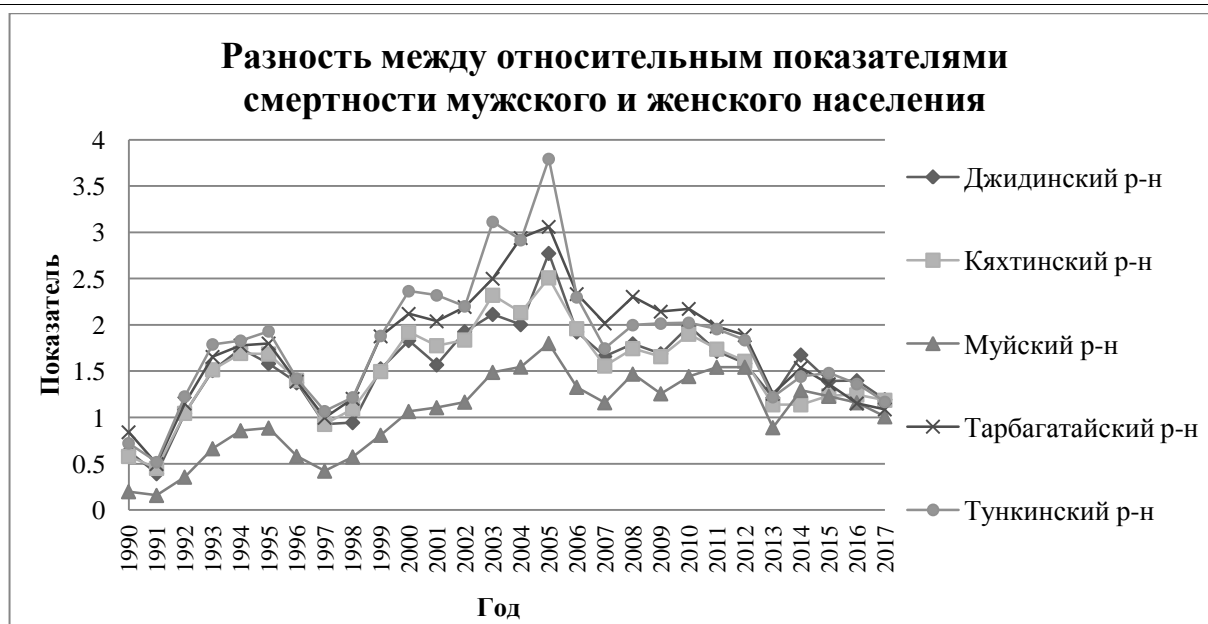
Рисунок 4 – Разность между относительным показателем смертности мужского и женского населения

Отмечается одинаковая динамика показателя смертности во всех районах в период с 1990 по 1998 год. Разница между относительными показателями мужской и женской смертности с 1999-2005 растёт во всех районах, но с 2006 снижается.