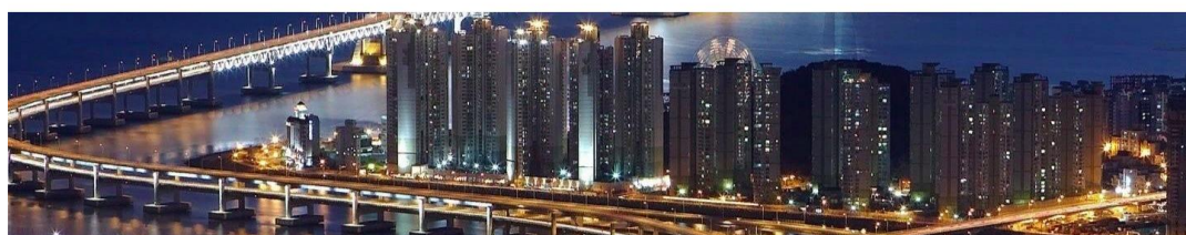
Рисунок 7. Параллакс-скроллинг эффект водопада и города