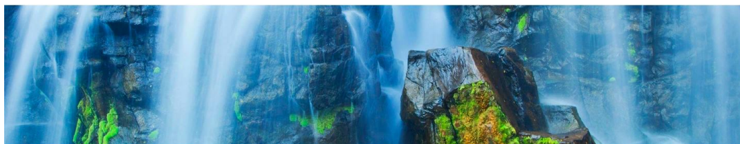
Рисунок 6. Параллакс-скроллинг эффект гор и водопада