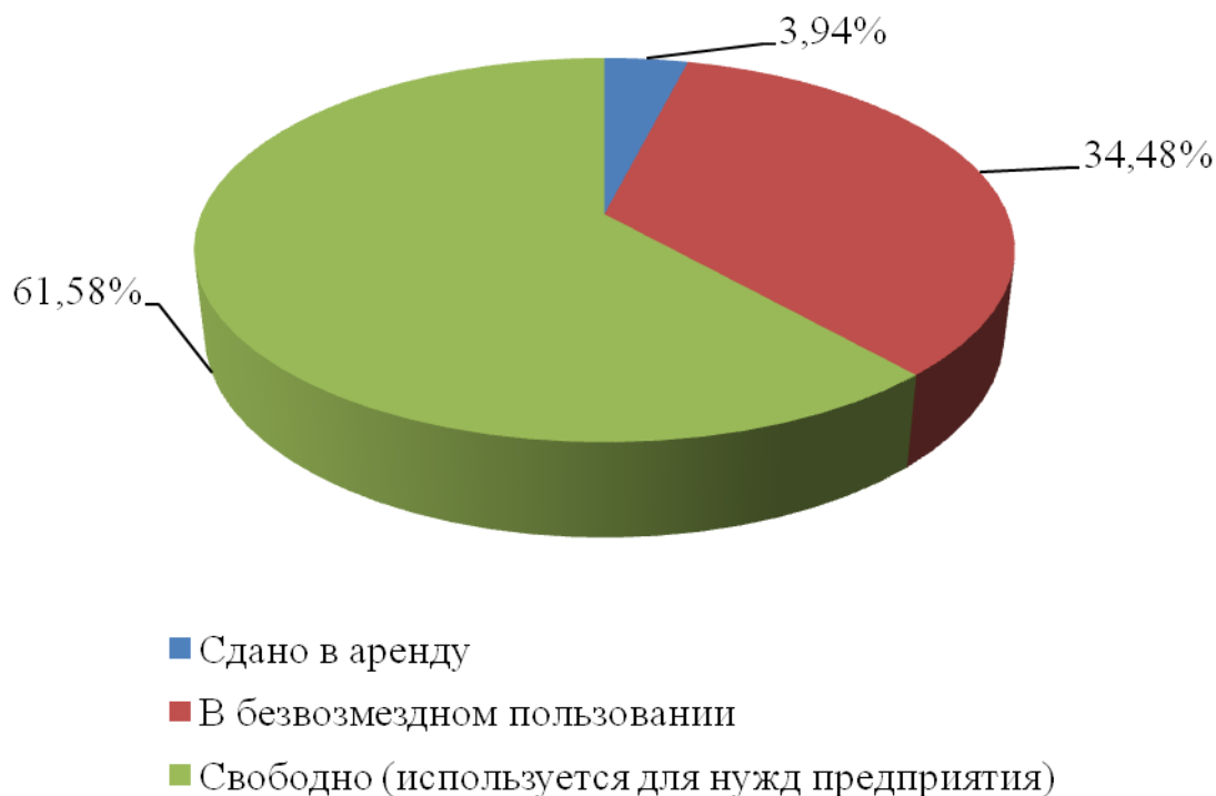
Рисунок 2 – Использование площадей имущественного комплекса Стадиона им. В. И. Ленина