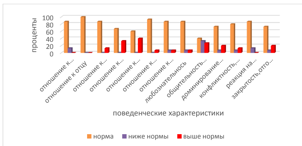
Рис. 1 Результаты диагностики внутрисемейных отношений по методике Рене Жилия

На первом этапе исследования нами были определены критерии внутрисемейных отношений у детей старшего дошкольного возраста. По каждой шкале мы подсчитали какое количество детей соответствует (см. рисунок 1).