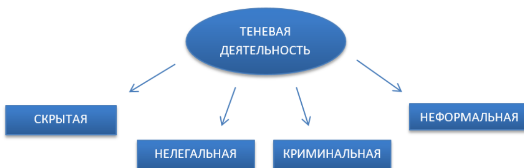
Рисунок 1 – Виды теневой деятельности

У большинства авторов можно увидеть такие названия, как скрытая, нелегальная, криминальная и неформальная экономическая деятельность. Виды теневой деятельности можно рассмотреть на рисунке 1, представленном ниже.