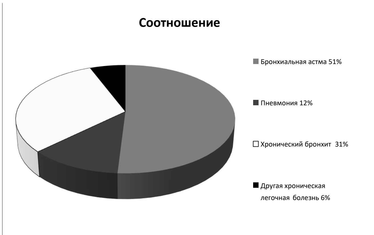
Рисунок 1. Соотношение распространённости бронхиальной астмы к другим патологиям дыхательной системы

симптомам одышки, свистящего дыхания, различных по длительности и интенсивности, стеснения в груди или кашля [2]. Основной признак болезни - приступ одышки, возникающий после контакта с аллергеном или физической нагрузки. Приступу может предшествовать охлаждение, курение [3].