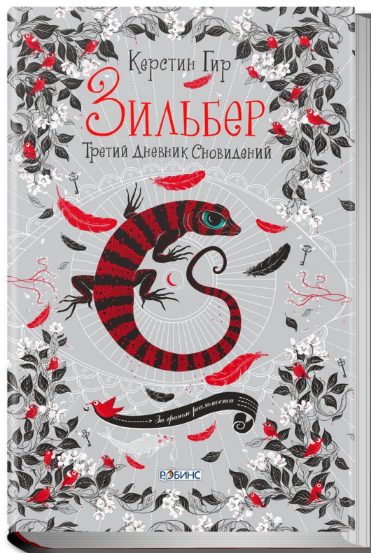
Рисунок 3 - «Зильбер. Третий дневник сновидений», Керстин Гир; Дизайнер обложки Алексей Баранов

При детальном рассмотрении стилизации обложек книг из серии «Зильбер» можно заметить иллюстрации с таинственными дверьми с ручками-ящерицами (рис 3), говорящими каменными фигурами, с ярко-красной ящерицей, большой глаз в центре книги, что смотрит на зрителя и иллюстрация обезумевшей няней с топором. Обложки данных книг, буквально, передают потенциальному покупателю дизайнерский стиль обложек, гипнотизируют. Название и аннотация выполнены художественным шрифтом с засечками (рис 1, 2, 3). Такой шрифт является более читабельным и удобным, так как глазам человека намного быстрее и легче распознавать символы с засечками.