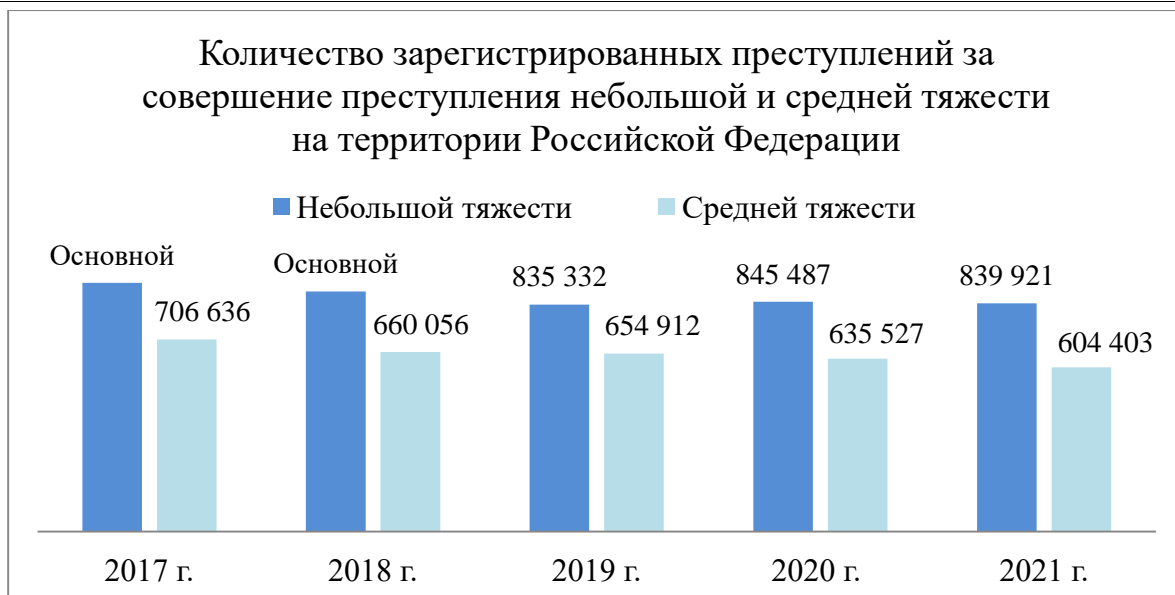
Рисунок 1. Количество зарегистрированных преступлений за совершение небольшой и средней тяжести на территории Российской Федерации в 2017-2021 гг.

В Хабаровском крае количество зарегистрированных преступлений на апрель 2022 г. составило 6 425 дел, 2435 из которых за совершение небольших преступлений и 2253 за совершение преступлений средней тяжести.