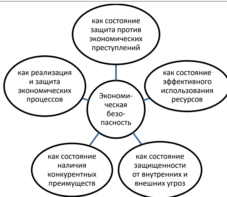
Рисунок 1 – Содержание экономической безопасности организации

Экономическая безопасность предприятия — это система, которая обеспечивает возможность предотвращения и устранения различных угроз, в целях защиты экономических интересов предприятия и недопущения ущерба в размерах, выше критического предела.