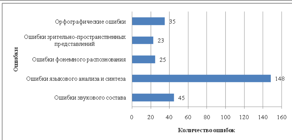
Рисунок 1 - Количественное соотношение типичных ошибок в письменных работах младших школьников

Как показал анализ письменных работ, наибольшее количество зафиксированных ошибок составляют ошибки на почве недоразвития языкового анализа и синтеза. Реже всего отмечались ошибки звукового состава.