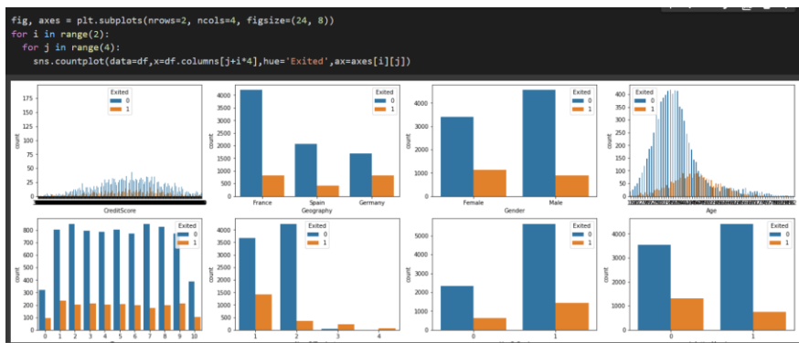
Рисунок 5 - Первичный анализ данных

Нужно выяснить какие данные оказывают наибольшее влияние на отток клиентов. Для этого строим гистограммы с различными параметрами. Исходя из графиков видно, что наибольшее влияние оказывают активность, количество продуктов и возраст (рис.5).