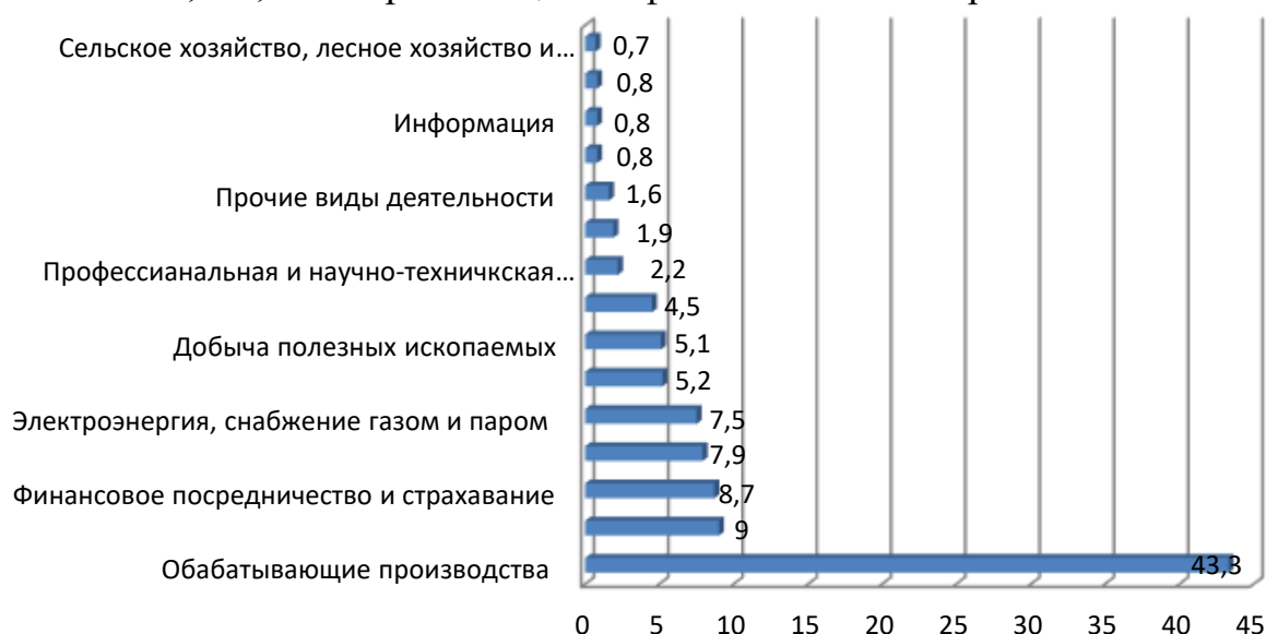
Рисунок 1. Выручка предприятий по видам экономической деятельности в 2019 году (в процентах к общему объему выручки предприятий экономики)

доля - 91,5 % общего объема сформирована предприятиями реального сектора экономики, а 8,5 % - организациями финансового сектора.