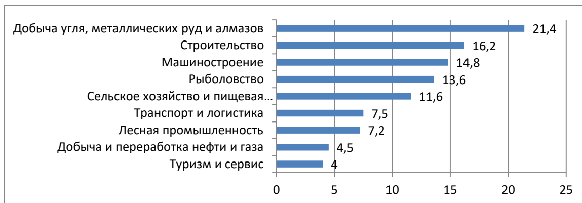
Рисунок 1 – Оценка кадровой потребности в отраслях экономики Дальневосточного федерального округа в перспективе до 2025 года, тыс. чел. [2]

Также необходимо отметить, что потенциальные работодатели заняты в различных видах экономической деятельности, что свидетельствует о востребованности специалистов различных профилей, однако, наиболее востребованным была и остается добывающая промышленность (рисунок 1).