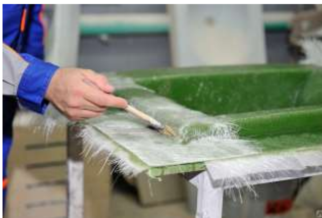
Рисунок 1 – Стеклопластик (GRP)

Еще одной новинкой в области инновационных материалов является использование композитных панелей на основе алюминия (рис. 2). Эти панели сочетают легкость алюминия с прочностью композитного материала, что делает их отличным выбором для фасадов зданий. Кроме того, композитные панели на основе алюминия обладают высокой огнестойкостью и устойчивы к воздействию влаги и ультрафиолетовых лучей, что делает их долговечными и подходящими для любых климатических условий.