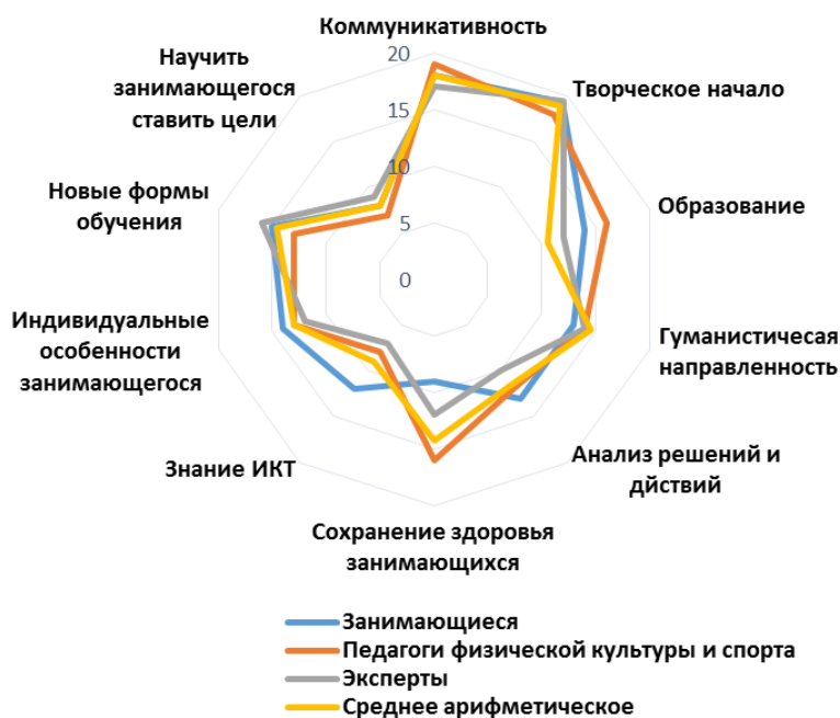
Рисунок 1 - Соотношение показателей профессионально-значимых качеств педагога по физической культуре и спорту

На рисунке 1 представлено соотношение показателей профессионально-значимых качеств педагога по физической культуре и спорту.