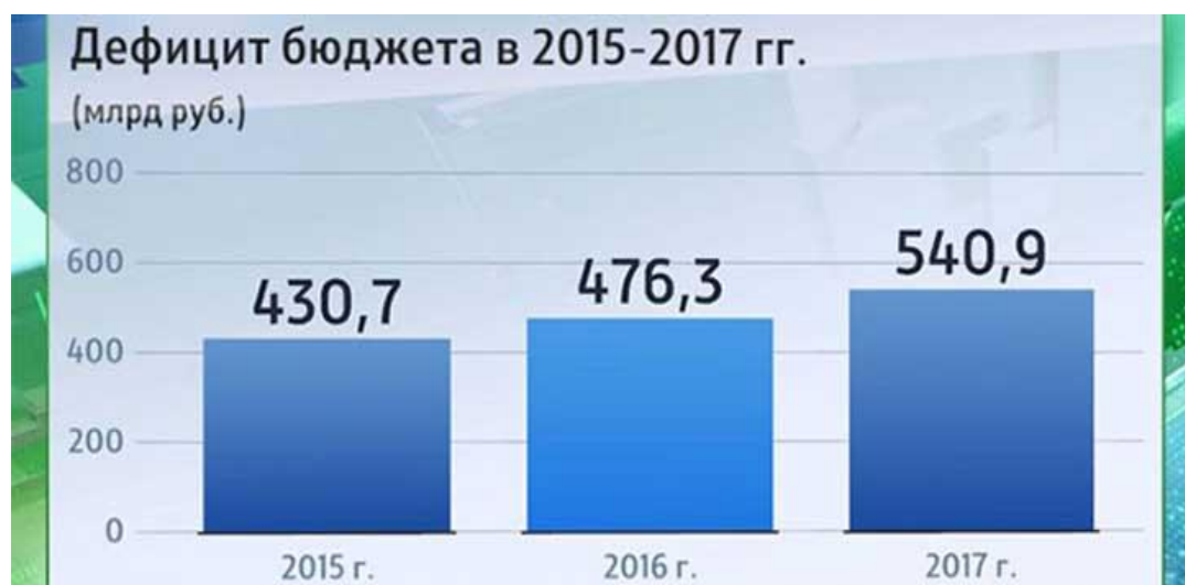
Рисунок 3- Дефицит бюджета в 2015-2017 г [4]

Перейдём к рассмотрению дефицита бюджета Российской Федерации за 2015-2017.