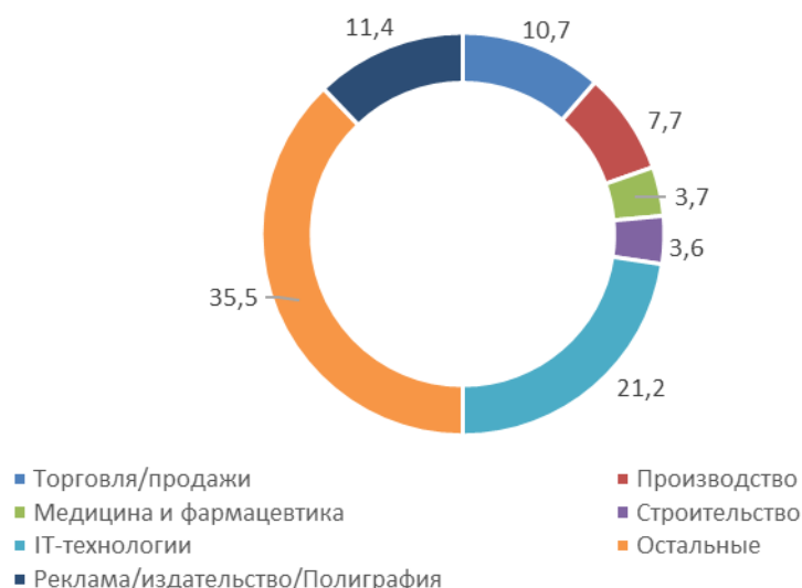
Рисунок 2 – Востребованные вакансии на рынке труда г.Красноярска в 2017 г. [11]

В 2016 году средняя заработная плата в Красноярском крае составила 34 702 рубля. Однако, реальная заработная плата снизилась на 7%. Самые высокие зарплаты были зафиксированы в добывающем секторе промышленности 89 300 рублей, финансовом секторе 51 200 рублей, в обрабатывающей промышленности 45 100 рублей, в сфере государственного и муниципального управления 44 700 рублей [1].